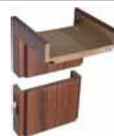
SEGMENTOVÁ obložková MDF zárubňa